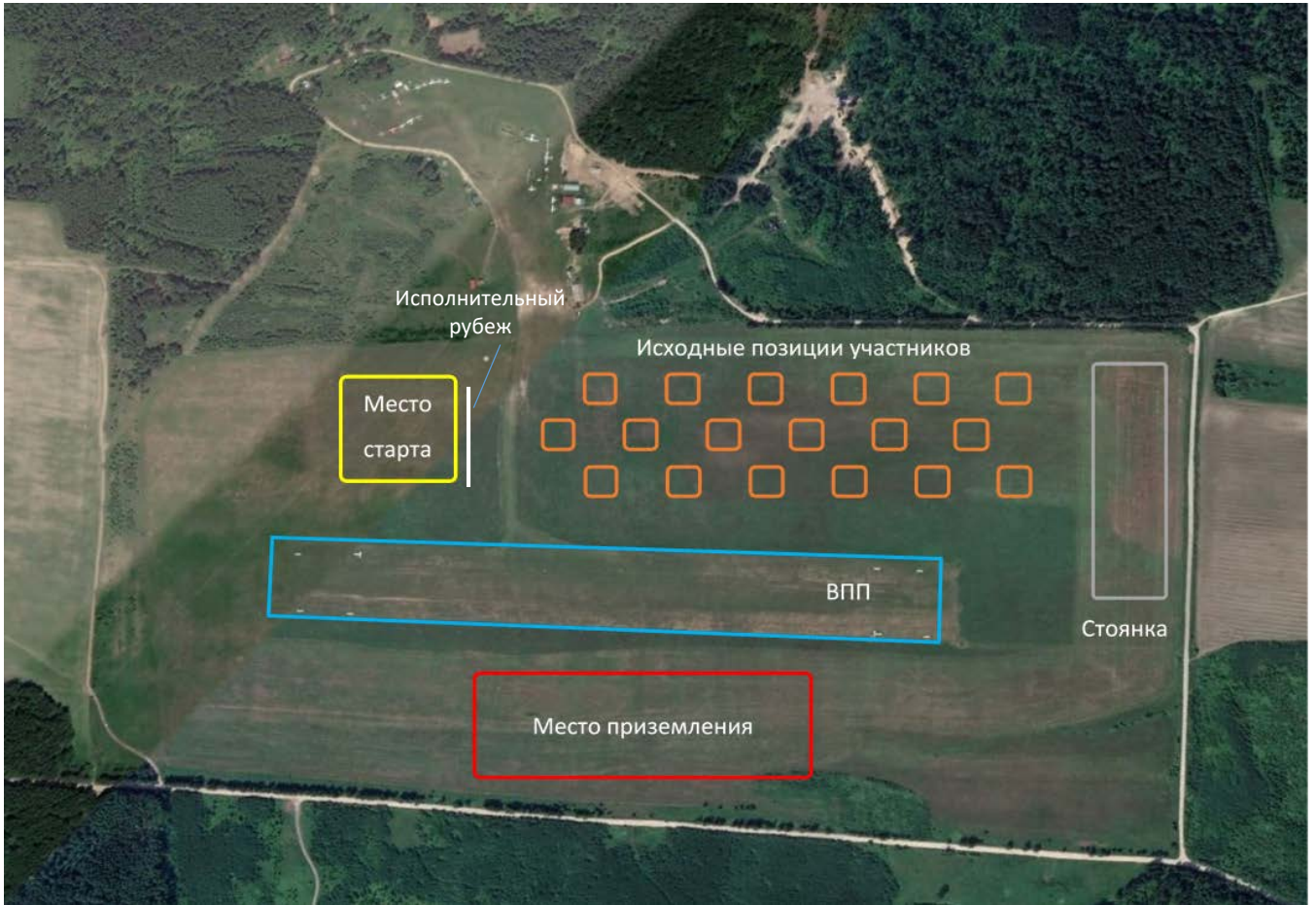
Рис. 1. Схема расположения участников